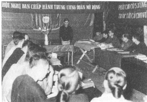
Hội nghị BCH TW Đoàn TNND Cách mạng Việt Nam mở rộng phát động phong trào “5 xung phong”, năm 1965.

Trong suốt chiều dài lịch sử của dân tộc, thanh niên nước ta từ thế hệ này đến thế hệ khác đã luôn nêu cao tinh thần yêu nước, không ngại gian khổ, hy sinh, sẵn sàng dấn thân vì sự nghiệp dựng nước và giữ nước. Trong những năm tháng chiến tranh, hàng triệu thanh niên Việt Nam đã xung phong ra trận với khát vọng hòa bình, độc lập và tinh thần “quyết tử cho Tổ quốc quyết sinh”. Những phong trào “Ba sẵn sàng”, “Năm xung phong” đã trở thành những ngọn đuốc soi đường cho nhiều thế hệ thanh niên Việt Nam xả thân cống hiến vì đất nước. Trong thời kỳ tái thiết đất nước sau chiến tranh và thời kỳ đổi mới, tiếp nối truyền thống cha anh, các thế hệ thanh niên với trái tim cháy bỏng nhiệt huyết, với bàn tay, khối óc và tinh thần tình nguyện đã hăng hái đến với vùng biên giới, hải đảo, đến với các công trình lớn của đất nước, cống hiến tuổi thanh xuân cho sự nghiệp xây dựng và bảo vệ Tổ quốc Việt Nam xã hội chủ nghĩa.