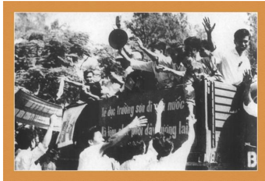
Học sinh Hà Nội phấn khởi trước lúc lên đường gia nhập lực lượng TNXP hưởng ứng phong trào “3 sẵn sàng”.

Ngày 21/6/1965, Thủ tướng Chính phủ ra Chỉ thị số 71/TTg-CN giao cho Trung ương Đoàn Thanh niên Lao động Việt Nam (sau này là Đoàn TNCS Hồ Chí Minh) tổ chức các Đội Thanh niên Xung phong chống Mỹ cứu nước tập trung phục vụ công tác giao thông vận tải. Từ đây, các Đội Thanh niên Xung phong chống Mỹ cứu nước được thành lập nhanh chóng theo yêu cầu của cuộc kháng chiến. Với quyết tâm “Xẻ dọc Trường Sơn đi cứu nước”, “Tất cả để đánh thắng giặc Mỹ xâm lược”, đã có trên 14 vạn cán bộ, đội viên thanh niên xung phong tình nguyện tham gia 170 Đội Thanh niên Xung phong và 50 đại đội Thanh niên Xung phong trực thuộc ở miền Bắc; 5.000 cán bộ, đội viên thanh niên xung phong tập trung và 35.000 cán bộ đội viên thanh niên xung phong cơ sở ở miền Nam.