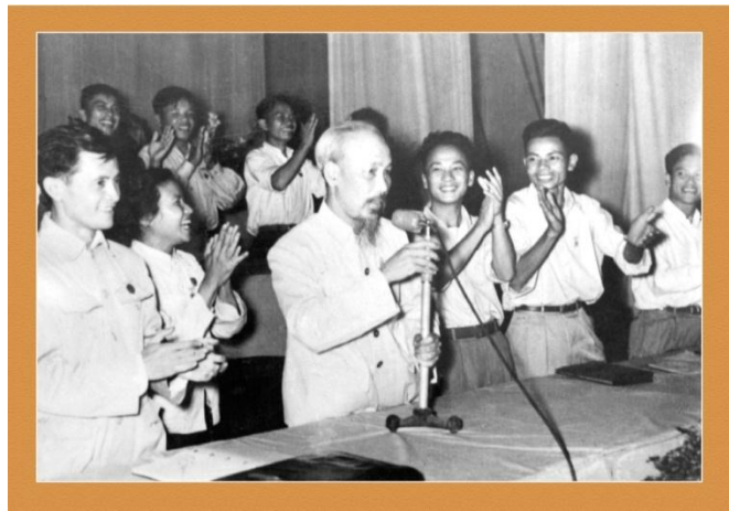
Chủ tịch Hồ Chí Minh huấn thị tại Đại hội đại biểu toàn quốc Đoàn TNLD Việt Nam lần thứ II (11/1956), tại Nhà Hát lớn Hà Nội.

Từ năm 1925, trong tác phẩm Đường Kách mệnh, Hồ Chí Minh đặt vấn đề phải xây dựng một tổ chức thanh niên cộng sản ở Việt Nam. Sau một thời gian do Người trực tiếp chuẩn bị và đề nghị với Trung ương Đảng, ngày 26-3-1931, Thanh niên Cộng sản Đoàn ra đời. Đó là thời điểm mang nhiều ý nghĩa đặc biệt trong phong trào thanh niên yêu nước theo xu hướng tiến bộ ở nước ta.